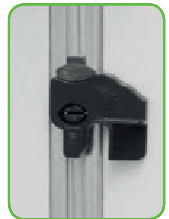
Verriegelung bei geschlossenen Auszügen

Die Schließstange befindet sich (von vorne gesehen) auf der rechten Innenseite des Korpus. Die Auszüge lassen sich im geöffneten Zustand mit leichtem Druck an der Unterseite des Auszuges nach oben aus den Teleskopschienen aushaken, um besser an die Verriegelungsstange zu gelangen. Die Verriegelungen lassen sich ohne Werkzeug in die gewünschte Stellung bringen: Bewegen Sie die Verriegelung einfach in die gewünschte Richtung. Das Einsetzen erfolgt einfach, indem die Auszüge auf die ausgezogenen Schienen (vorne überstehend) aufgelegt und mit vorsichtigem Druck zurück in den Korpus geschoben werden. Sie rasten anschließend automatisch ein. Nun sollte die Verriegelung wieder ordnungsgemäß funktionieren.